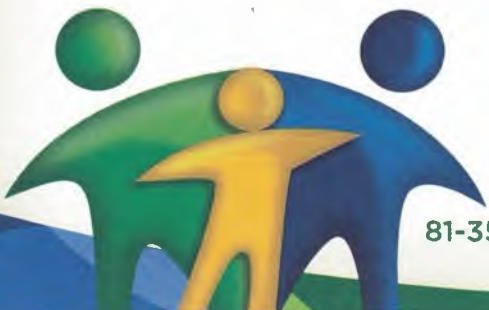
ANGELO LABANCA ALBANEZ FILHO Prefeito

São Lourenço da Mata, 28 de março de 2016.