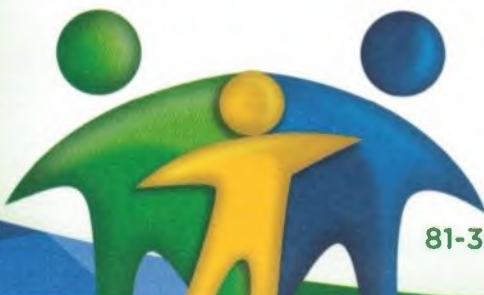
ANGELO LABANCA ALBANEZ FILHO Prefeito

São Lourenço da Mata, 06 de Abril de 2016.