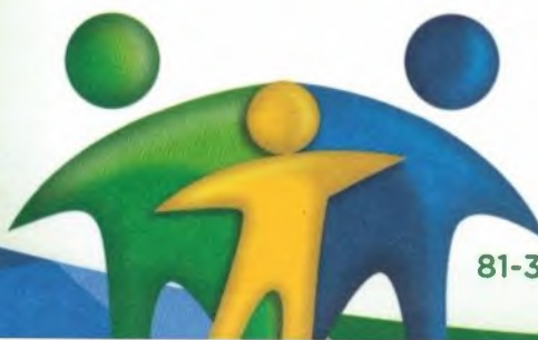
ANGELO LABANCA ALBANEZ FILHO Prefeito

São Lourenço da Mata, 06 de Abril de 2016.